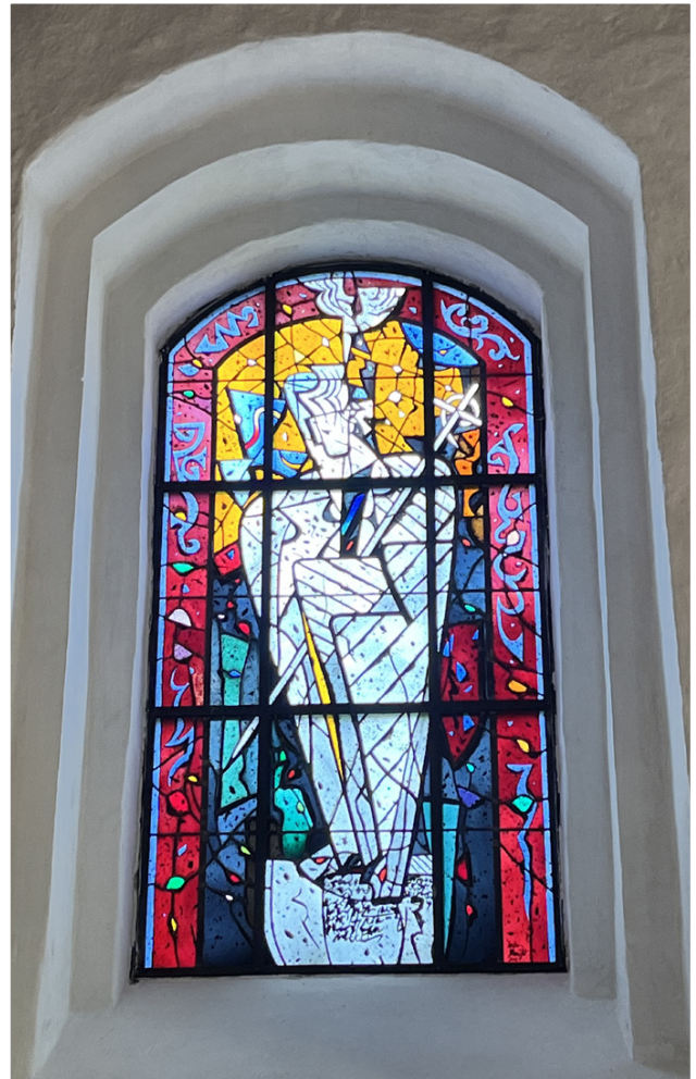
Das Auferstehungsfenster in der Vicelin-Kirche St. Jacobi lässt Hoffnungslicht herein

In diesem Spannungsfeld bewegen wir uns in dieser Zeit. Auf der einen Seite haben wir das Osterfest, das Fest des Lebens vor Augen, und das Pfingstfest, das von Gemeinschaft zwischen allen Menschen und Brückenbauen von Mensch zu Mensch erzählt. Auf der anderen Seite haben wir die menschengemachten Realitäten dieser Welt, die uns tagtäglich, Hiobsbotschaften gleich, anfechten. Das ist manchmal nur schwer auszuhalten.